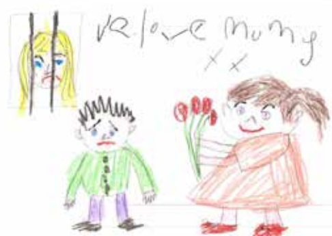
Action for Children Family Help Centre & Help Hub, HMP Grampian

Er bod y raddfa ymateb yn is na'r disgwyl, mae'r Tîm Teuluoedd yr Effeithir Arnynt gan Garchariad yn credu ei fod yn rhoi syniad da o ddarlun Gogledd Cymru. Diolch i bob un o'r sefydliadau hynny a dreuliodd yr amser yn llenwi'r holiadur hwn, bydd y tîm mewn cysylltiad os oes cais wedi ei wneud am hynny. Cwblheir ymgynghoriad dilynol mewn tua 18-24 mis.